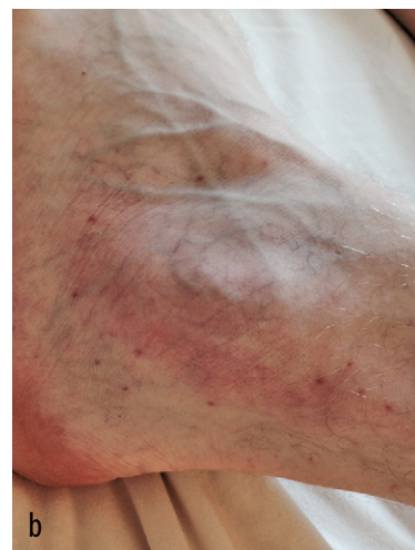
FIGUUR (a) Het ecg van een 24-jarige man met houdingsafhankelijke pijn op de borst en koorts. Er zijn diffuus opgetrokken ST-segmenten zichtbaar, met ST-depressie in aVR en PT-a-segmentdepressie (met name in afleidingen V4 en V5). (b) Foto van de linker enkel van de patiënt. Er is een erythemateuze verkleuring van de huid zichtbaar met petechiën. (Afgedrukt met toestemming van belanghebbende.)